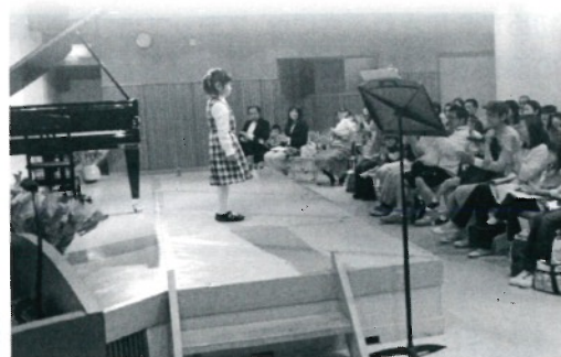
(写真) ピティナ・ピアノステップ イメージ